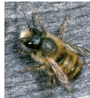
Insekten (Rote Mauerbiene)