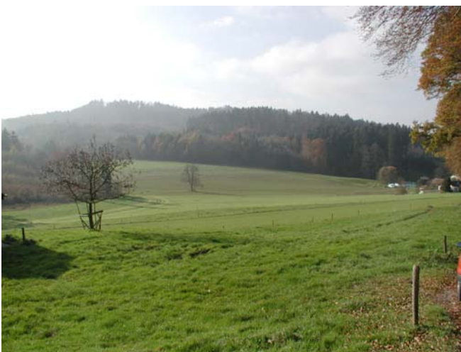
Ansicht von Süd-Osten vor Projektbeginn am 20.11.2001