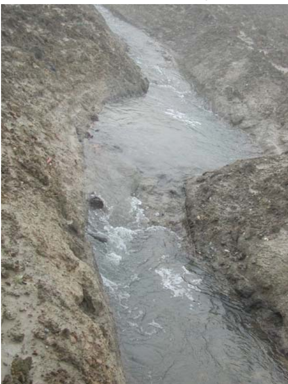
Kurz nach der Ausdolung: karge Böschungen