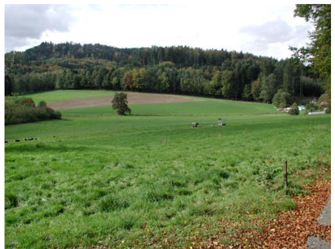
Nach 3 Jahren am 17.10.2005; die Hecke ist erkennbar