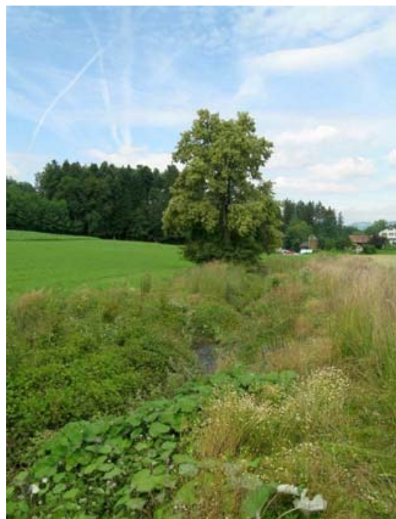
Die Böschungen sind ohne Bearbeitung bewachsen