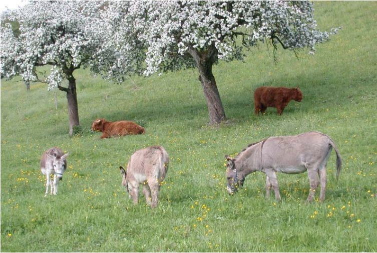
Extensivweide am Gofi mit Schottischen Hochlandrindern und Eseln